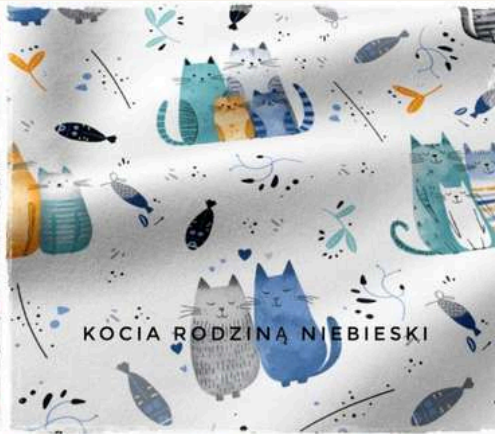
KOCIA RODZINA NIEBIESKI