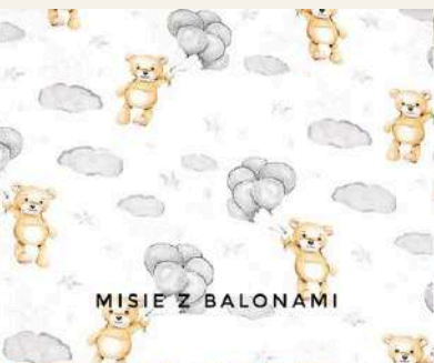
MISIE Z BALONAMI