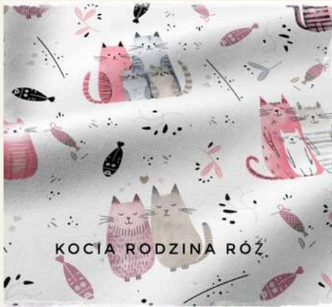
KOCIA RODZINA RÓŻ.