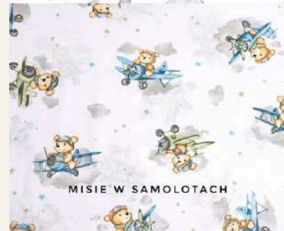
MISIE W SAMOLOTACH