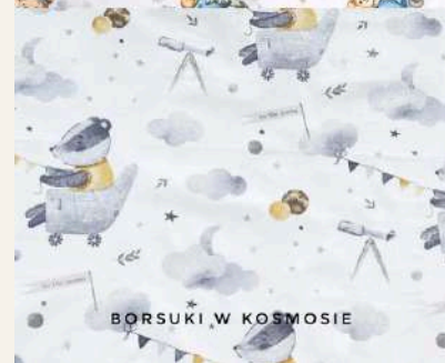
BORSUKI W KOSMOSIE