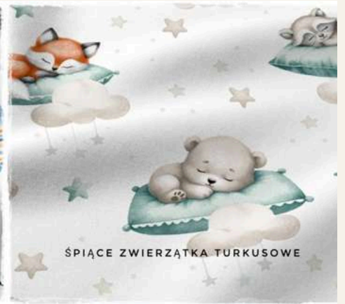
SPIĄCE ZWIERZĄTKA TURKUSOWE