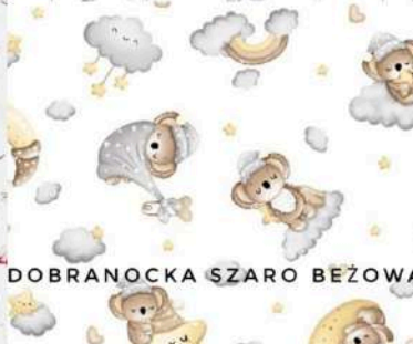
DOBRANOCKA SZARO BEŻOWA