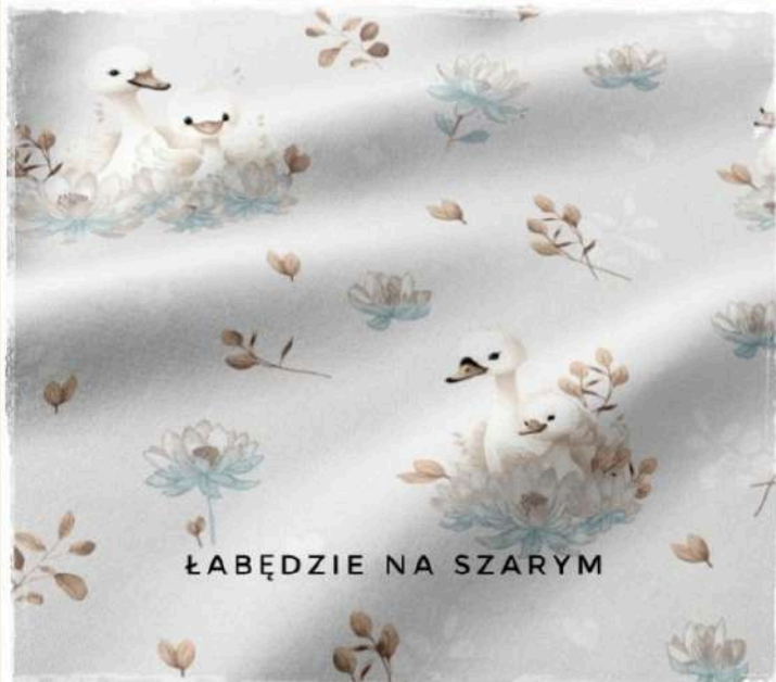
ŁABĘDZIE NA SZARYM