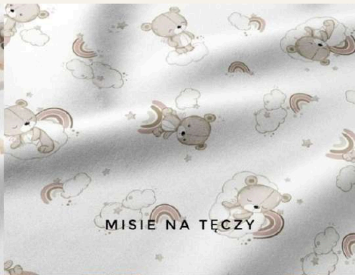
MISIE NA TĘCZY