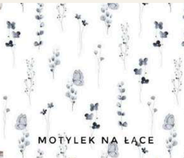
MOTYLEK NA ŁĄCE