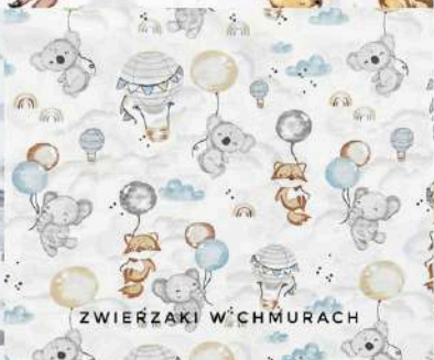
ZWIERZAKI W CHMURACH