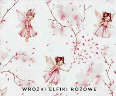
WRÓŻKI ELFIKI RÓZOWE