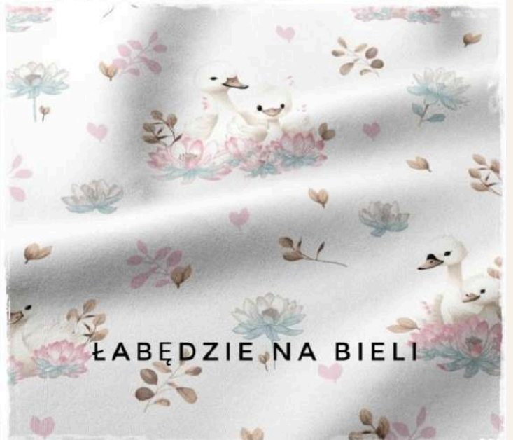
ŁABĘDZIE NA BIELI