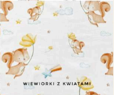
WIEWIORKI Z KWIATAMI