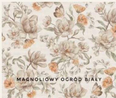
MAGNOLIOWY OGRÓD BIAŁY