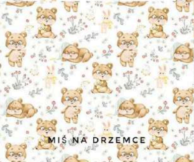
MIS NA DRZEMCE