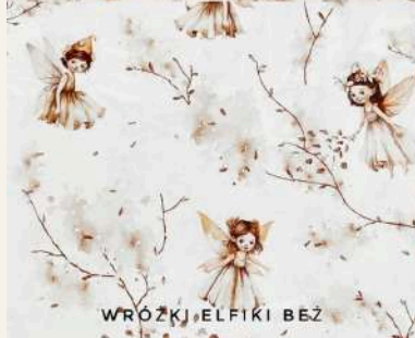
WRÓŻKI ELFIKI BEZ