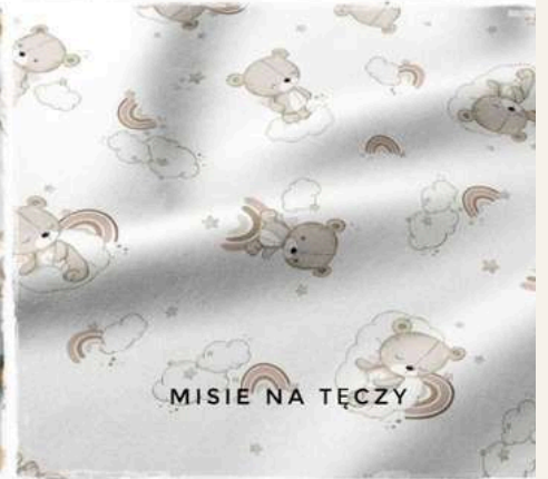
MISIE NA TĘCZY